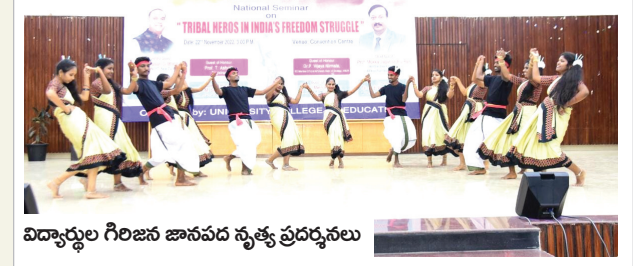
విద్యార్థుల గిరిజన జానపద నృత్య ప్రదర్శనలు