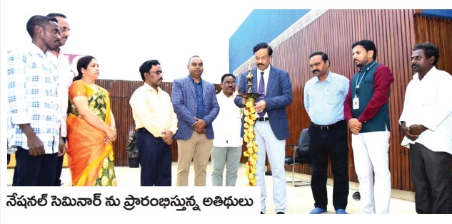
నేషనల్ సెమినార్ ను ప్రారంభిస్తున్న అతిథులు