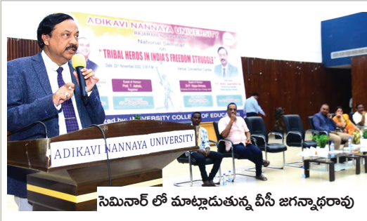
సెమినార్ లో మాట్లాడుతున్న వీసీ జగన్నాథరావు